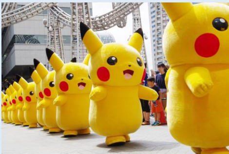
(c) 2018 Pokemon. (c) 1995-2018 Nintendo/Creatures Inc./GAME FREAK inc.