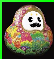
石川県観光PR マスコットキャラクター 「ひやくまんさん」

「輪島塗」のお髭や「金箔」の体、「九谷焼」の色彩などの伝統工芸や、「石川門」「ことじ灯籠」などの景勝地が全身に描かれ、石川の魅力をギュッと凝縮したデザインのマスコットキャラクターです。