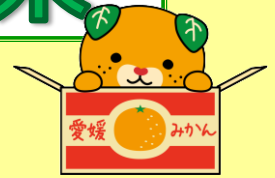
愛媛県イメージアップキャラクター みきゃん