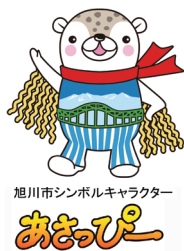
旭川市シンボルキャラクター あさひくま