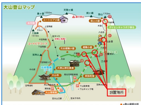
山岳スマート道標設置場所(大山・烏ヶ山)