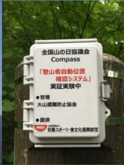
山岳スマート道標