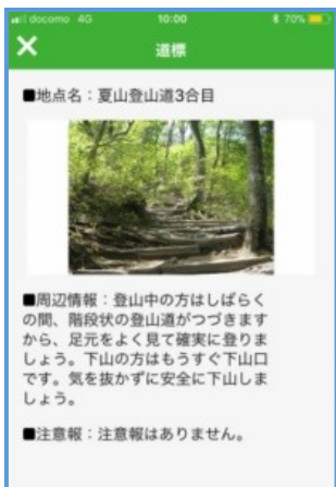
スマホで提供される安全登山情報