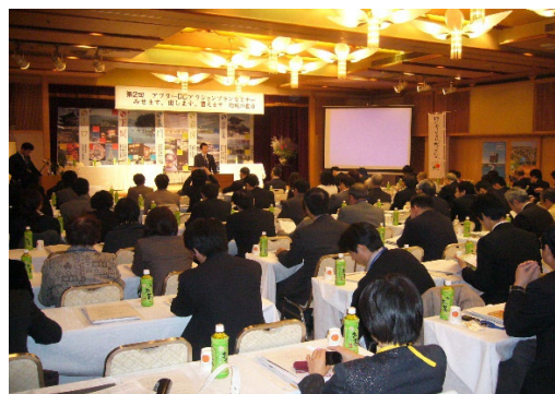
キャンペーンセミナー説明会風景