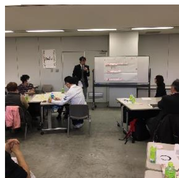
川西市ワークショップ講師