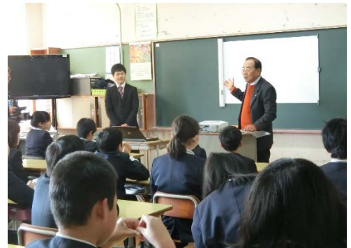
▲昨年度の他校での出前教室の様子

出前教室は、児童の行政に対する関心を高めてもらうことや、総務省の行政相談制度への理解を深めてもらうことなどを目的としています。