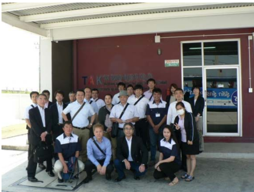
◆ 海外視察 (青年部／タイ視察時)