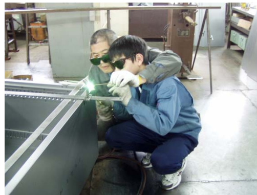
◆ 中学生を対象とした 職場体験事業の風景