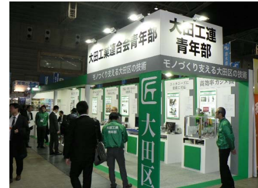
◆ 工業展示会への共同出展 (青年部／テクニカルショー)