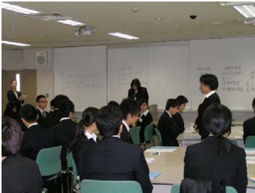
◆ 新入社員セミナーの風景