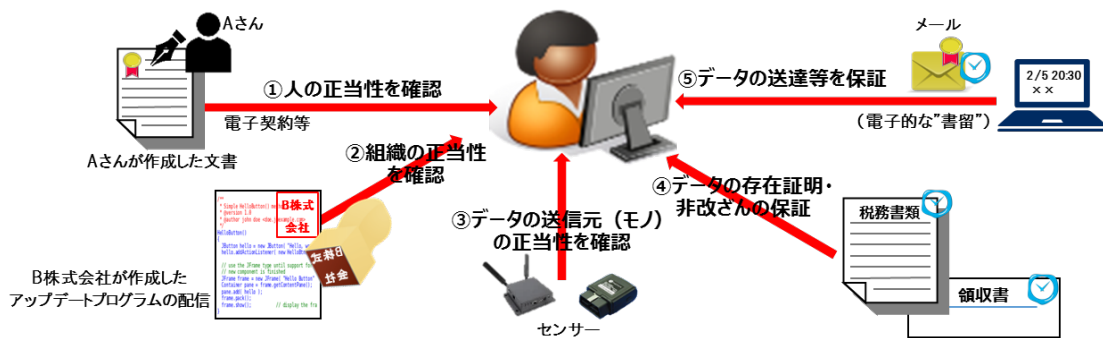
図1 トラストサービスの活用例