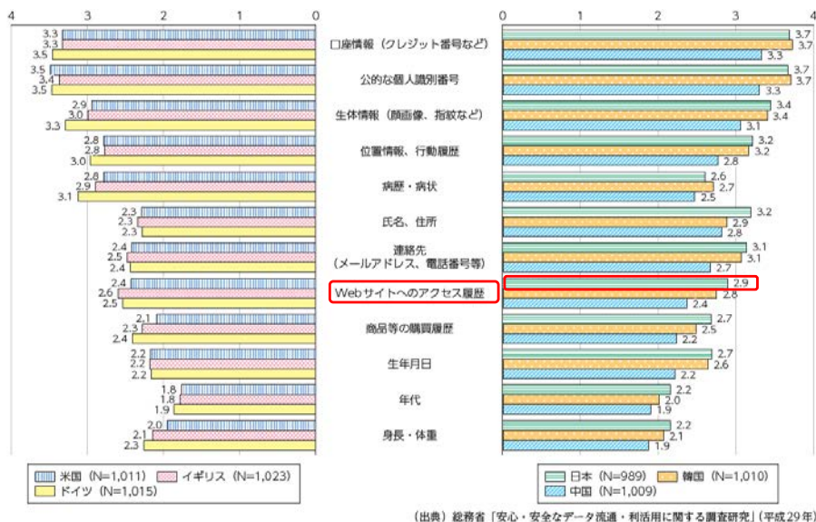
表2 各パーソナルデータに対する不安感

また、6か国共通で提供に強い不安感があるデータは、「口座情報」、「公的な個人識別番号」、「生体情報」、「位置情報、行動履歴」となっている。特に、アジア3か国では、基本情報である「氏名、住所」、「連絡先」及び「生年月日」が欧米3か国に比べて警戒心が強く、 我が国では、「Webサイトへのアクセス履歴」の提供に対する不安感が6か国の中で最も高い 10 。