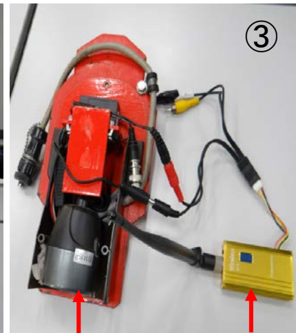
ワイヤレスカメラ本体①～③