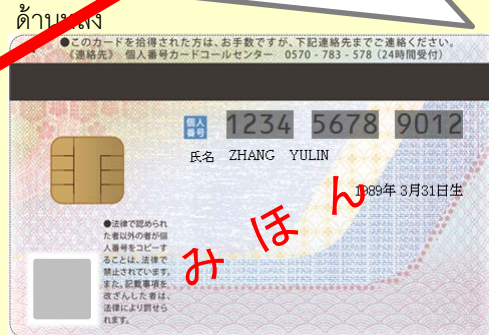
บัตรหมายเลขของจีน (แล้วแต่ความต้องการ: บัตรหมายเลขประจำตัว(ICการ์ด)พลาสติกที่มีรูปถ่าย มีระบุวันหมดอายุ)

ในกรณีที่ได้รับการอนุมัติในการเปลี่ยนแปลงวันหมดอายุการพำนักแล้วข้อมูลใหม่ต่าง ๆ นั้นจะไม่ปรากฏบนบัตรหมายเลขของจีนโดยอัตโนมัติ ผู้ที่มีบัตรหมายเลขของจีนนั้นจะต้องไปดำเนินการเรื่องที่สำนักงานในเขตที่อยู่อาศัย