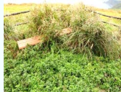
雑草が繁茂しベンチに座れない