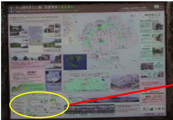
【事例3】QRコードを携帯電話で読み込んでもリンク先が削除(1事例)