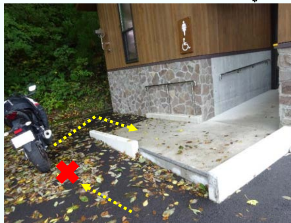
トイレ入口のスロープ前にバイクが駐車され、車いすでの利用を妨げている

【事例1】 駐車場に車いす使用者用駐車スペースが確保されていない（駐車場を整備している27事業で17事例）