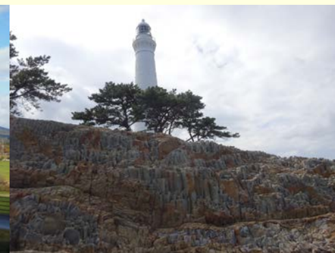
日御碕(島根県:島根半島地域)