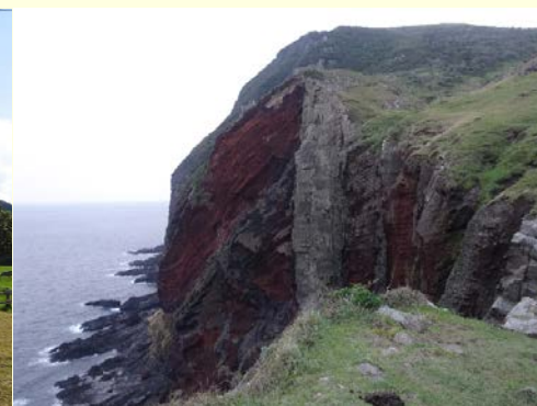
赤壁(島根県:隠岐島地域)