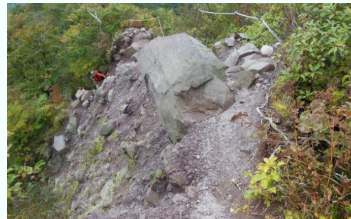
「ユートピアコース」の崩落箇所

【事例2】 大山の上級者ルート「ユートピアコース」には崩落箇所があるが、このコースには管理者がなく、未修復のまま。（1事例）