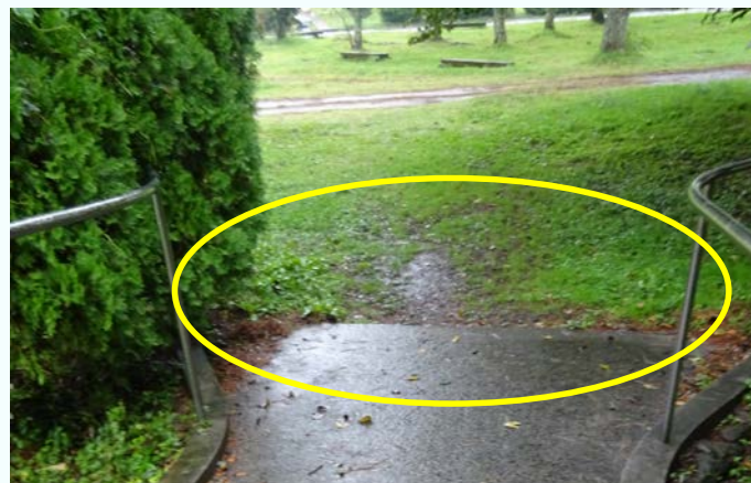
スロープ前が未舗装。雨の日はぬかるんで車いすで通行しにくい