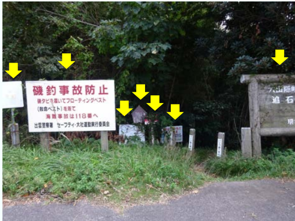
【事例1】乱立している(1事例)