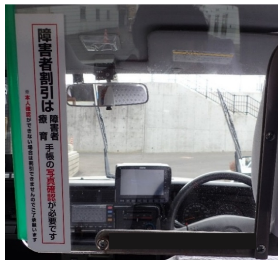
図1 実際の表示状況