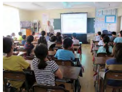
(行政相談出前教室)