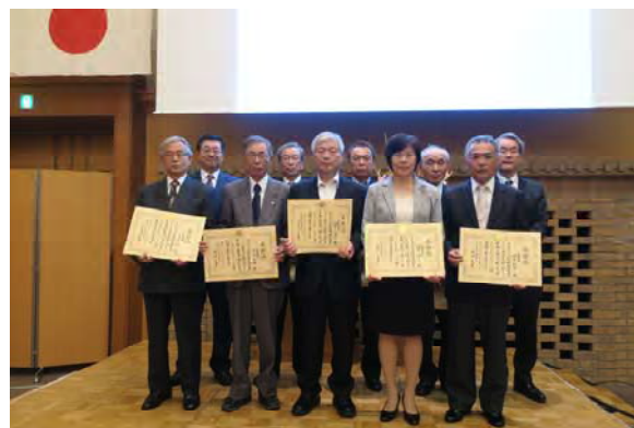
（平成 29 年度行政相談委員全体会議での表彰の様子）