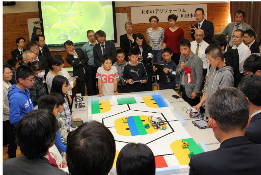
平成29年度「未来の学びフォーラム」におけるプログラミング講座