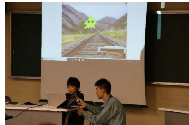
成果発表会でゲームの出来栄を披露