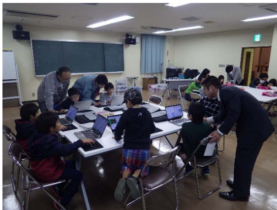
スクラッチにも挑戦