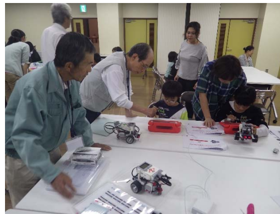
高齢者メンターや保護者と学び合い