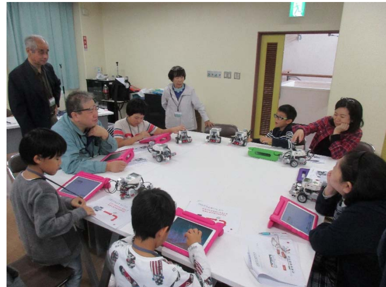
大人も参加したオープン講座