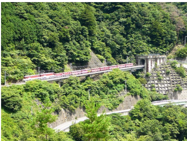
アプト式鉄道 井川線