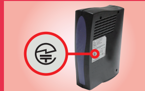
無線LAN 据え置き型の機器:裏面

多くの場合、無線機器の型式名称や製造者が記載された銘板や外箱に表示されています。