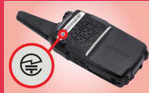
トランシーバー:裏面または内蔵バッテリーを取り外した部分