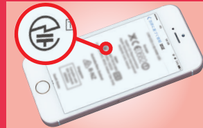
スマートフォン等では、液晶画面に表示される場合もあります