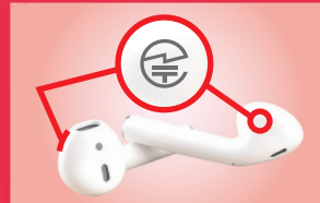
ワイヤレスイヤホン:本体やタグなど