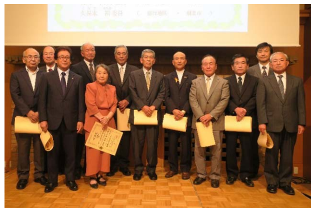
（平成30年度行政相談委員全体会議での表彰の様子）