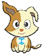
総務省行政相談センター

茨城県内には、「茨城行政監視行政相談センター」(総務省行政相談センター・きくみみ茨城)が設置されています。