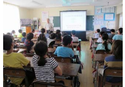
(行政相談出前教室)