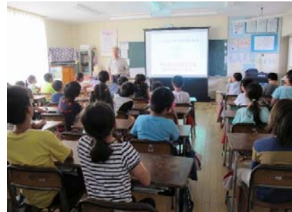
（行政相談出前教室）