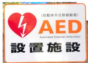
(仙台第3合同庁舎の施設入口の表示)

・厚生労働省は、H27.8に、関係省庁、都道府県、市町村等に対し、必要なときにAEDを設置している場所にたどり着けるよう、施設入口への表示を要請