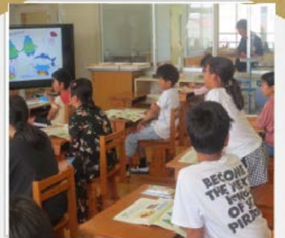
▲ キャラクターPRの意見を発表する児童

児童考案の地元キャラクターをPRするにはどうしたらよいかの意見発表を行いました！！