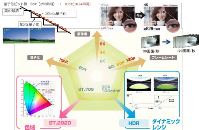
映像表現の高度化

技術試験事務等により得られたデータの取りまとめができた技術から順次一部答申を希望する。 特に、映像圧縮方式の高度化に関する技術的条件については、令和元年度中の一部答申を希望する。