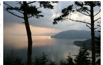
夜明けの琵琶湖湖畔

船舶に限らず、琵琶湖のマリンレジャーに関わる方々の安心・安全を確保するシステムを導入することにより、琵琶湖地域、ひいては滋賀県の地域振興にも貢献していきたいと考えています。