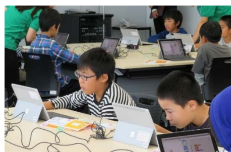
和歌山県での開催