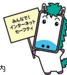
アドバイザー講習開催案内