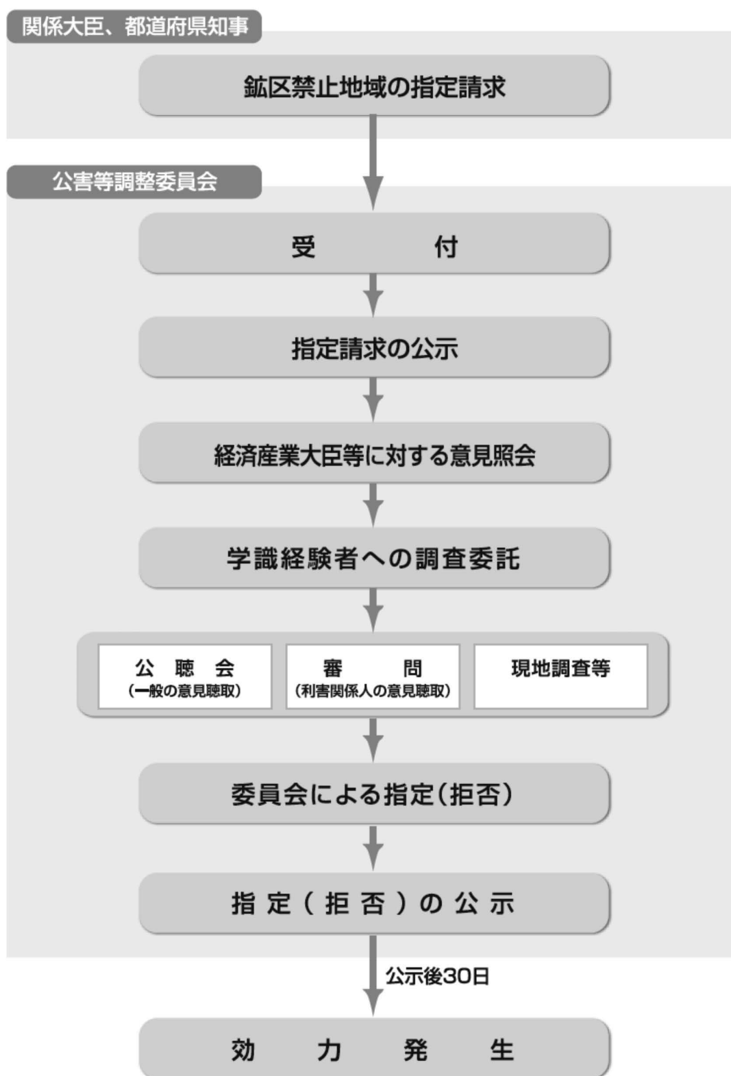
図 2 - 1 - 1 鉱区禁止地域の指定制度