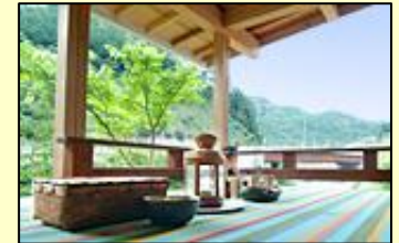
地元国産材を利用した家づくり