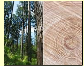
東白川村の東濃ひのき(国産材) 綺麗な木目と高い耐久性が特徴