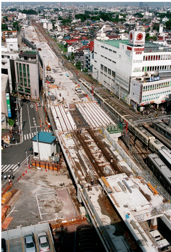
【複々線化工事が進む小田急線】