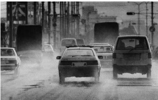
【スパイクタイヤにより削られた舗装道路の粉じんが舞い上がる町並み】

このような状況を背景として、平成元年8月に長野県在住の弁護士らが、同年10月に北海道在住の弁護士等が、国（関係省庁）を相手方として、スパイクタイヤの製造、輸入、販売及び使用を全面的に禁止する等の適切な措置を講ずることを求めて調停を申請しました。