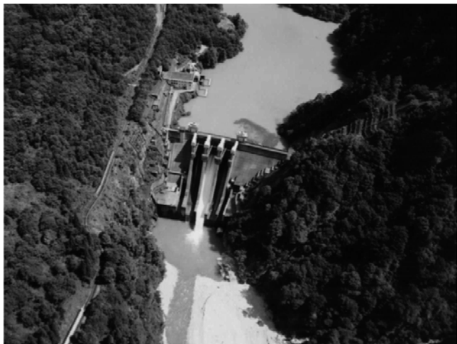
【排砂中の出し平ダム】

平成16年8月に嘱託があった富山県黒部川河口海域における出し平ダム排砂漁業被害原因裁定嘱託事件は、制度創設後30年余を経て、初めて公害等調整委員会に原因裁定嘱託がなされた事件です。