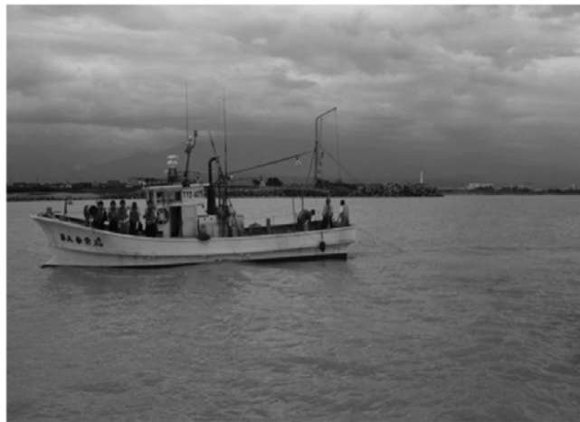
【裁定委員及び専門委員による現地調査】

する制度として広く認知されるようになり、平成30年度末までに8件の原因裁定嘱託を受け付けています。