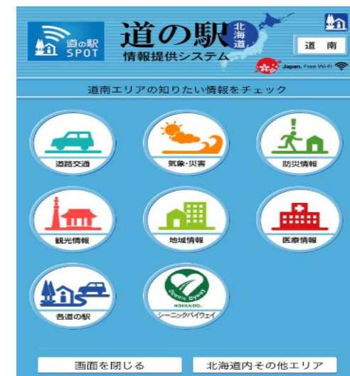
道の駅SPOTのポータルサイト