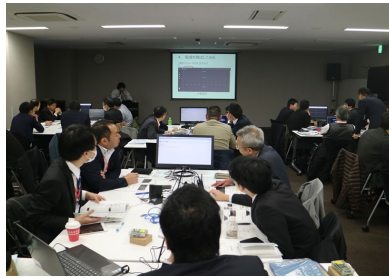
・ 講習会はグループ形式で行います