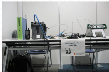
検査機器の写真(検査室)