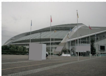
神戸市御崎公園球技場