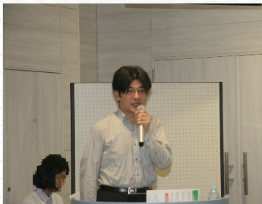
総務省の担当者による説明

続いて、国の担当者が講演し、総務省の担当者から「テレワークの最新動向と今後の政策展開」と題して、導入企業における生産性の向上や新卒採用力の向上、コスト削減の具体例などを説明しました。また、厚生労働省の担当者からは、テレワークにおける適切な労務管理のためのガイドラインやお試しで活用できるサテライトオフィス等について説明がありました。