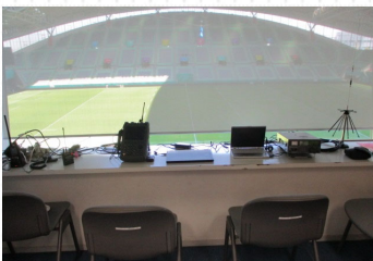
検査機器の写真(無線監視室)

9月18日(水)に東大阪市へ、また9月22日(日)は神戸市の会場へ検査、監視機器を搬入し、試合の数日前から無線機の検査や監視業務を行っており、管内8試合の円滑な運営に協力しています。