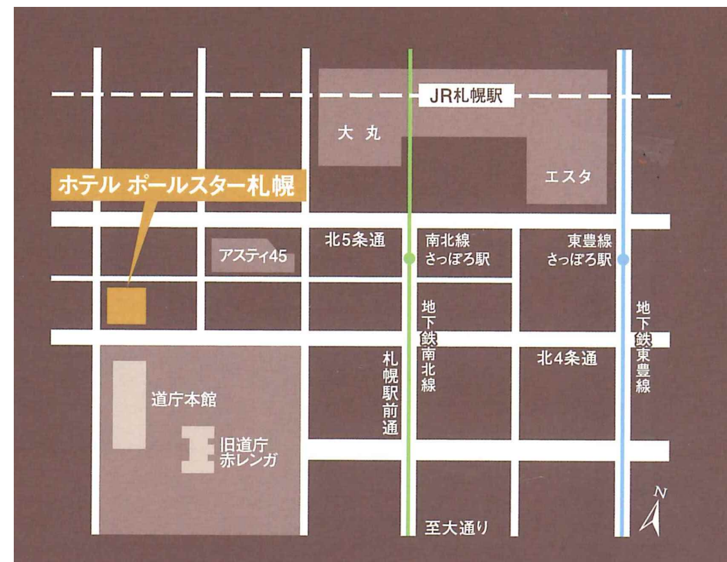
JR札幌駅南口から徒歩5分