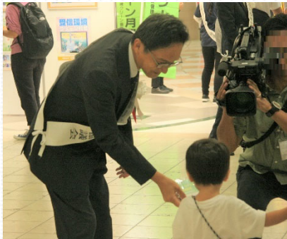
大阪市内の地下街で周知活動を行う佐々木近畿総合通信局長

近畿総合通信局及び近畿受信環境クリーン協議会は、10月の「受信環境クリーン月間」の期間中、テレビやラジオの受信障害防止のための周知・啓発活動等を重点的に取り組んでいます。