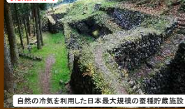
自然の冷気を利用した日本最大規模の蚕種貯蔵施設