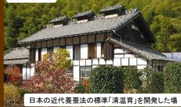
日本の近代養蚕法の標準「清温育」を開発した場