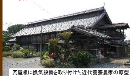
瓦屋根に換気設備を取り付けた近代養蚕農家の原型