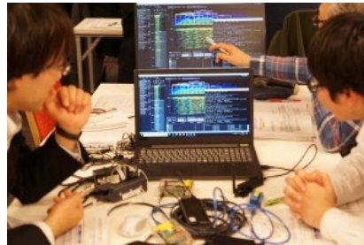
・機材を用いた無線管理実習の様相