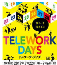
テレワーク・デイズ2019 ポスター