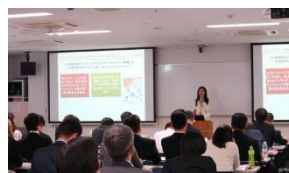
セミナー開催の様子