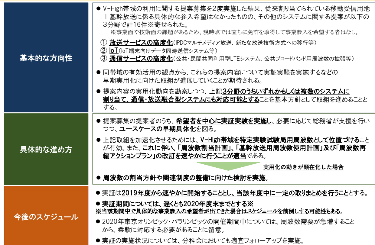
[図 01: 「V-High 帯域の活用方策に関する取りまとめ」概要 (資料 7-3 より抜粋)]