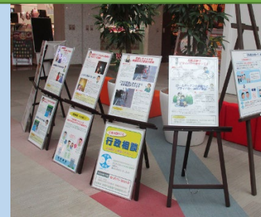
行政相談に関するパネルの展示