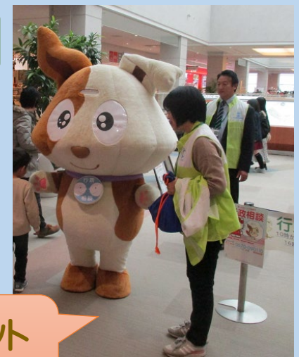
行政相談のマスコット「キクーン」も登場！