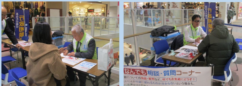
【行政なんでも相談・質問コーナー】 18 組の方々から 23 件の相談・質問を受け付けました。