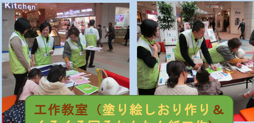
工作教室（塗り絵しおり作り & くるくる回るかんたん紙工作）

当日は、行政相談に関するパネルの展示や、お子様向けの工作教室を行ったほか、行政に関する相談や質問に、総務大臣から委嘱された行政相談委員や総務省行政相談センターきくみみ群馬の職員が対応しました。