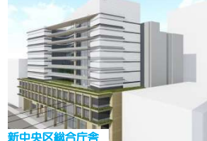
新中央区総合庁舎