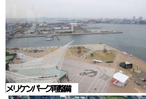
メリケンパーク再整備