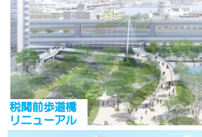
税関前歩道橋 リニューアル