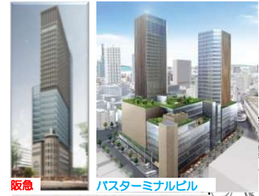
阪急 バスターミナルビル

凡例 整備完了 ■ 工事中 ■ 計画段階 ■ ■ 都市再生緊急整備地域 ■ 特定都市再生緊急整備地域