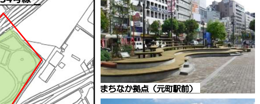
まちなか拠点（元町駅前）