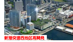
新港突堤西部地区再開発