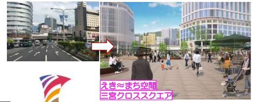
えきまちな空間 三宮クロススクエア