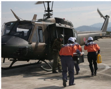
陸自ヘリへの通信機器搬入の様子

当局は、今後も各種訓練を通じて関係機関との連携をより一層深め、被災自治体への災害対策用移動通信機器等の貸与等の支援を迅速に行ってまいります。