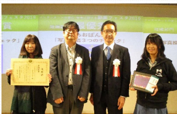
【短編部門 最優秀賞】

洛陽総合高等学校 Haruki Motion Pictures×infini 「遊び感覚」