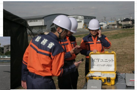
通信機器の設営・通信訓練の様子