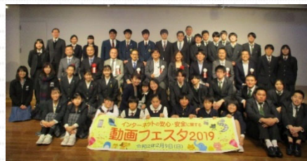
各賞を受賞された皆様