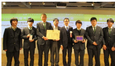
【長編部門 最優秀賞】

https://www.youtube.com/playlist?list=PLad9gX9uot5ZnFOT11Y1Qw_ajsDDUaOZd