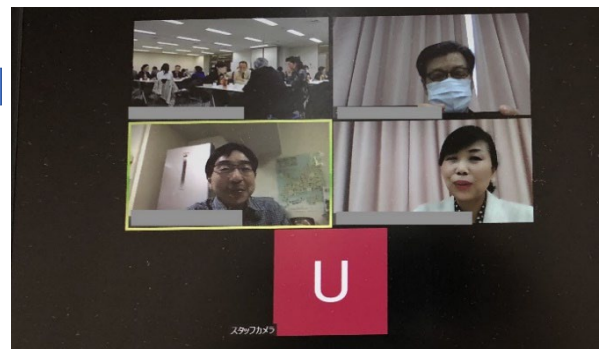
地域デビューを応援するオンライン活動の例