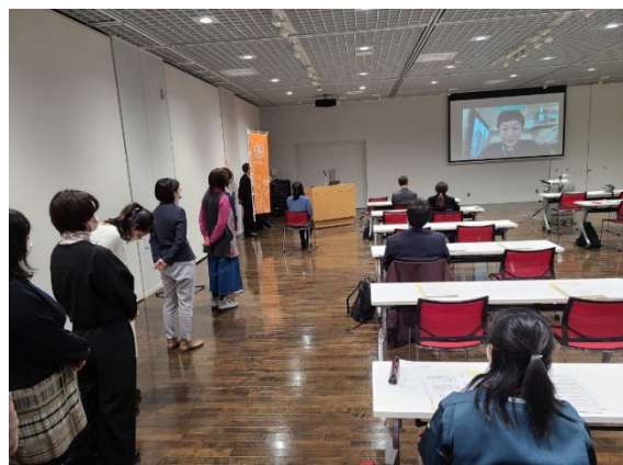
会場で個別相談も