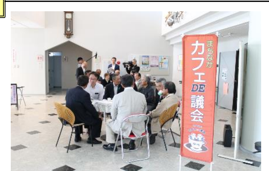
まちなかカフェDE議会の様子

まちなかカフェDE議会における住民の意見やアンケート調査の結果を踏まえ、議会から町長に対して、政策提案書「安全・安心なまちづくりを目指す防災体制」を提出するなど、具体的な政策化につなげている。