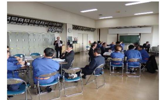
浦幌消防第1分団と議員のなり手不足について意見交換