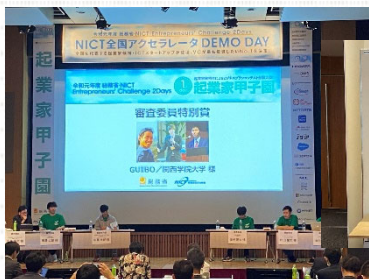
《起業家甲子園》【審査委員特別賞】 「現地ガイドと訪日外国人のマッチングサービス『GUIBO』」 関西学院大学

なお、今年の起業家甲子園・起業家万博は新型コロナウイルス感染防止の観点から無観客で開催されました。