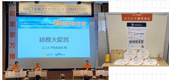
《起業家万博》【総務大臣賞】 「カルテ要約支援AIソフトウェア『SATOMI』の開発・展開」 エニシア株式会社