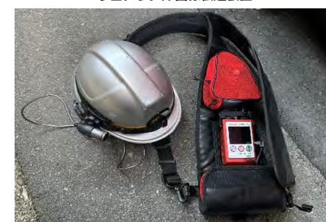
ウェアラブル画像伝送装置