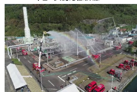
ドローンによる俯瞰映像