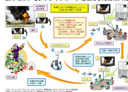
携帯端末や電子ホワイトボードを活用した情報共有