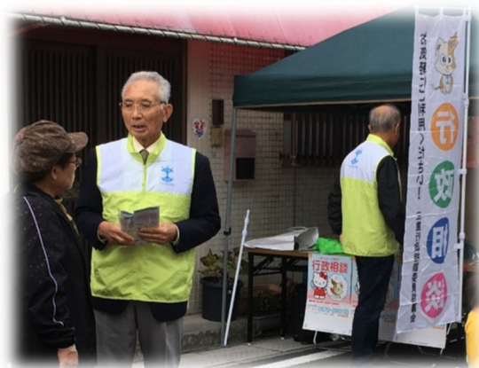
イベント会場で、広報活動を行う委員(左から2人目)

委員は、行政相談制度を周知し、行政に対する要望等を受け付けるため、他の津市担当行政相談委員と共に、地元の自治会役員等地域の住民を対象とした行政相談懇談会を開催、また、地元で開催される「久居まつり」会場で特設相談所を開設するとともに、広報活動を実施している。