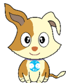
行政相談のマスコット キクーン

行政相談委員は、無報酬のボランティアとして、国民の皆様から、行政に対する苦情、相談を受け付け、相談者への助言や関係機関に対して改善の申入れなどを行っています。