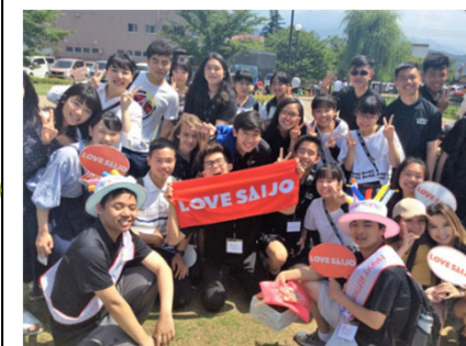
<愛媛県西条市の例 (H30モデル事業)> 「自立循環型関係人口プラットフォーム構築事業」での「LOVE SAIJO ファンクラブ」を活用した地場産品のPR