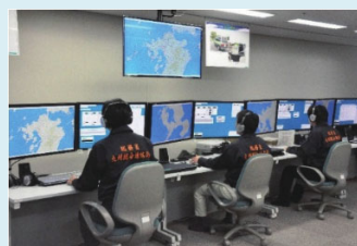
【電波監視システム（DEURAS）】

携帯電話など、「電波の安全性」に対する関心が高まっており、「電波の安心・安全」に関する正しい知識を提供し、正しい理解の普及啓発に取り組んでいます。また、電波が人体に影響する不安や疑問についての相談対応も行っています。