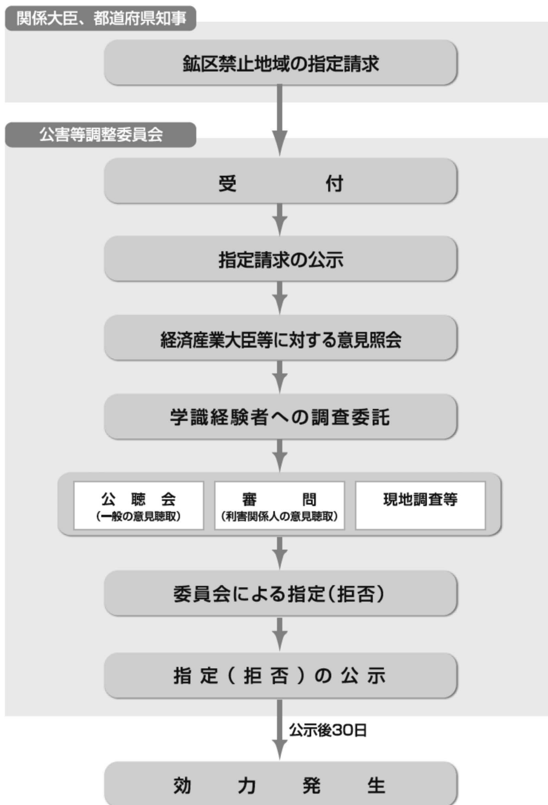
図 2 - 1 - 1 鉱区禁止地域の指定制度