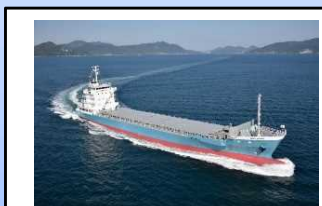
高度二酸化炭素低減化船