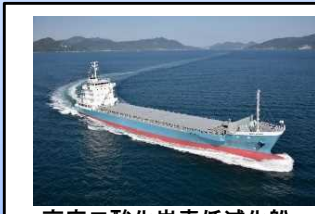
高度二酸化炭素低減化船