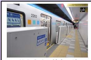
仙台市地下鉄東西線