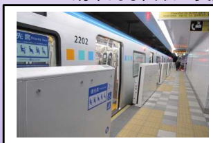
仙台市地下鉄東西線