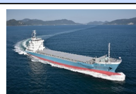
高度二酸化炭素低減化船