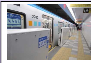
仙台市地下鉄東西線